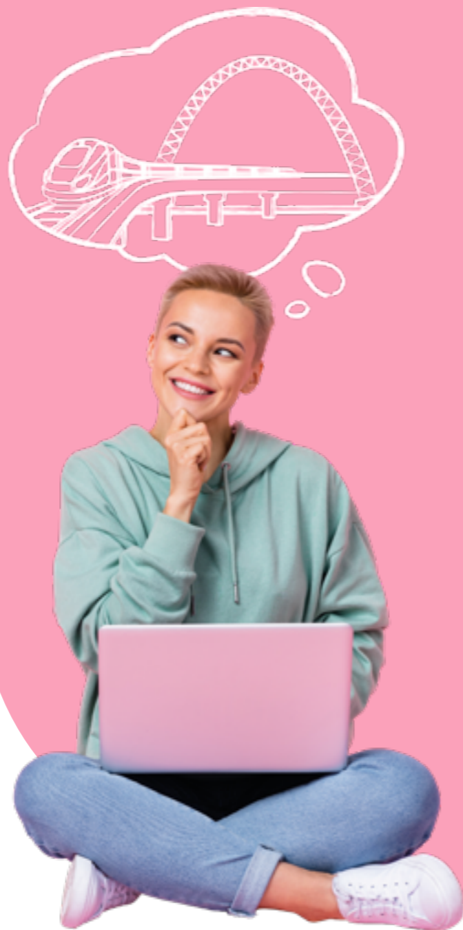
Figura professionale più richiesta: Manager della Mobilità urbana