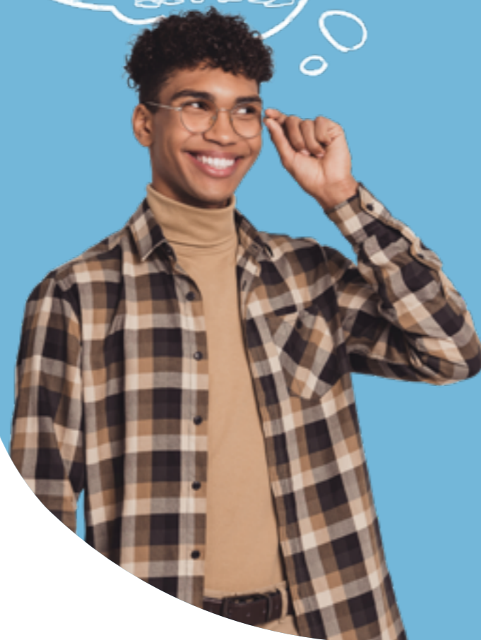
Figura professionale più richiesta: Esperto in Politiche Internazionali