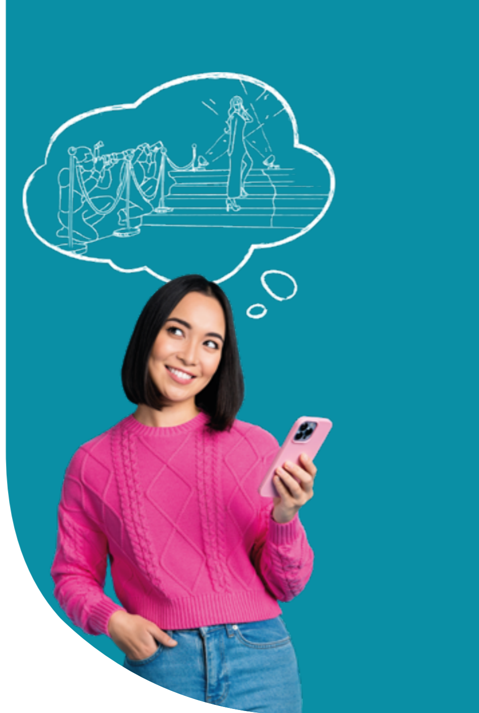
Figura professionale più richiesta: Project Manager per l'industria culturale