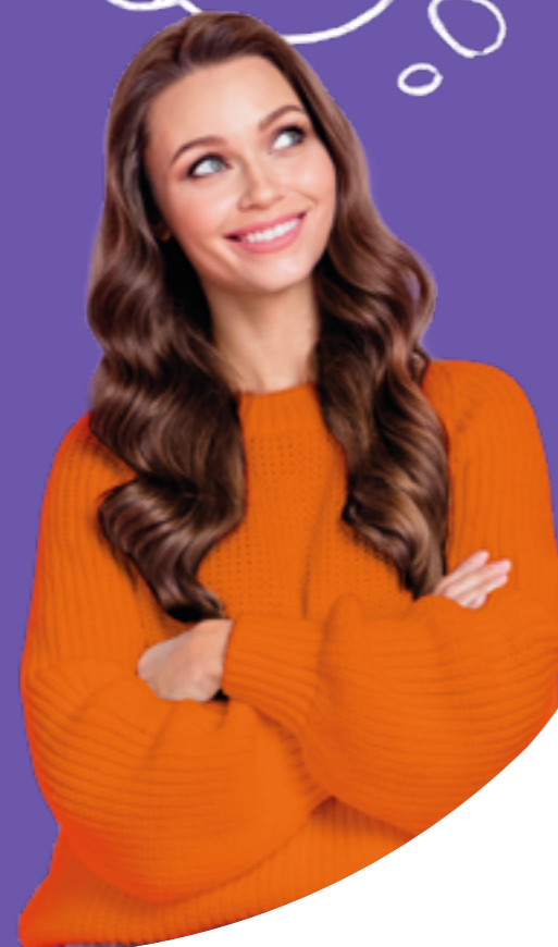
Figura professionale più richiesta: Accounting Analyst