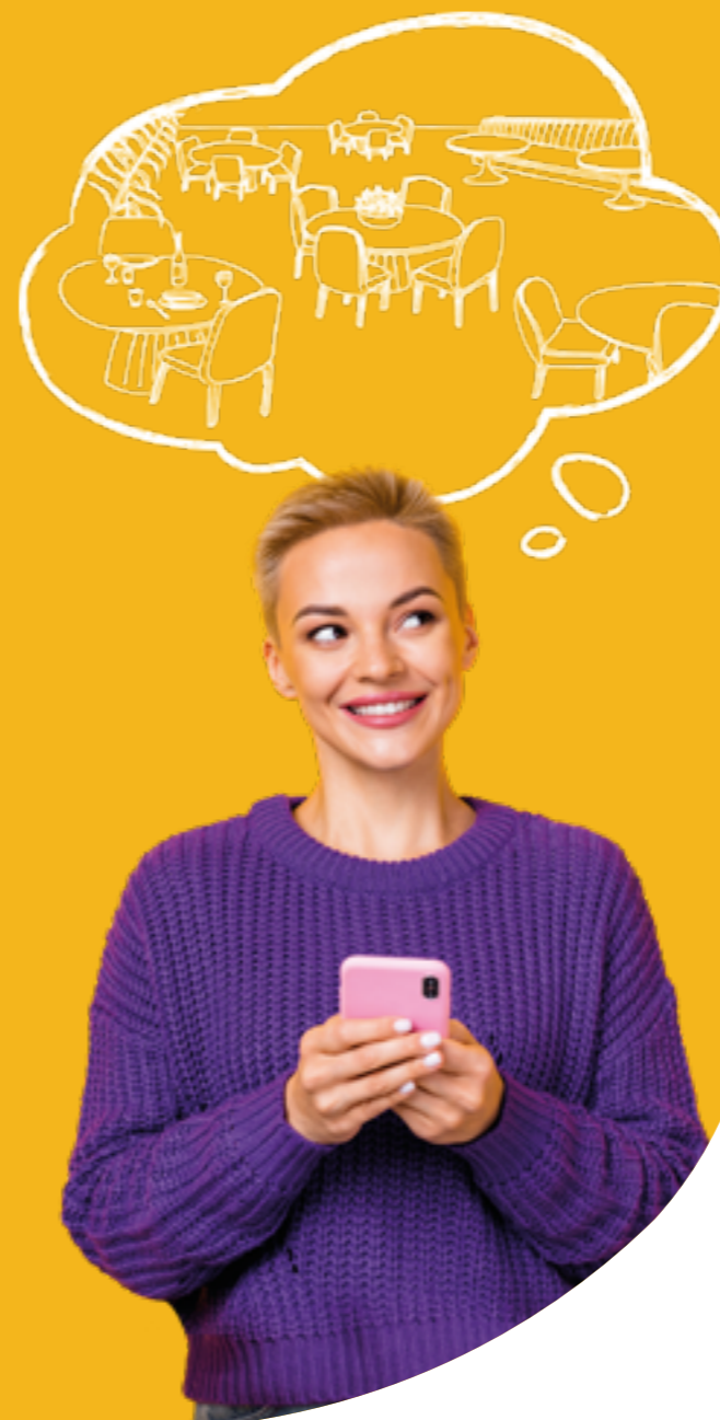
Figura professionale più richiesta: Food & Beverage Manager