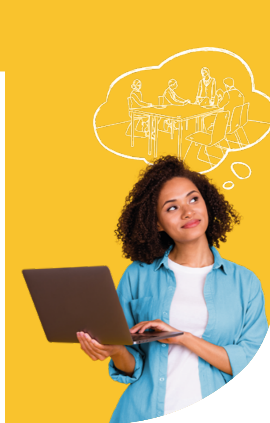
Figura professionale più richiesta: Junior Accounting Analyst