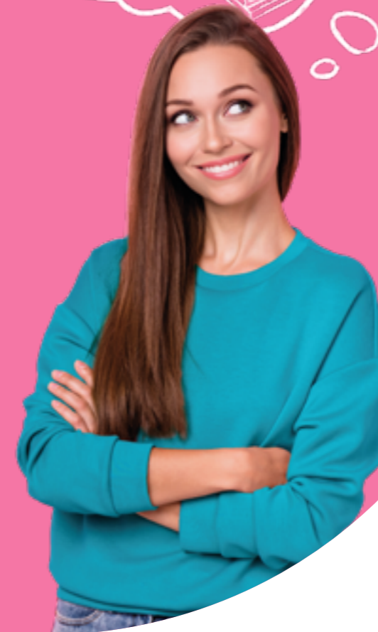
Figura professionale più richiesta: Manager della Trasformazione Digitale