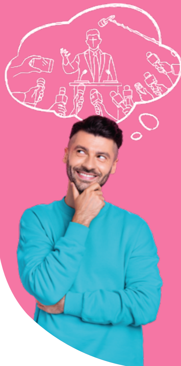
Figura professionale più richiesta: Social Media Manager