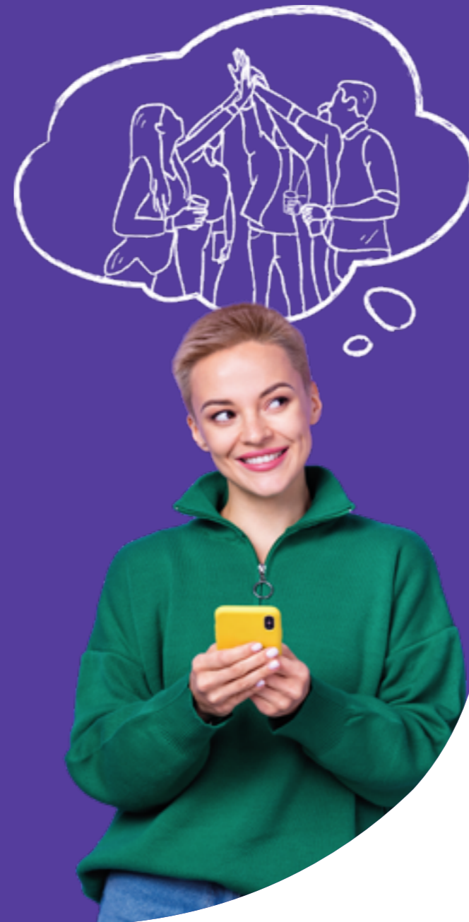
Figura professionale più richiesta: Analista e Specialista in Scienze Sociali