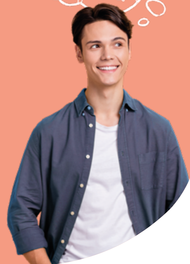
Figura professionale più richiesta: HR Manager