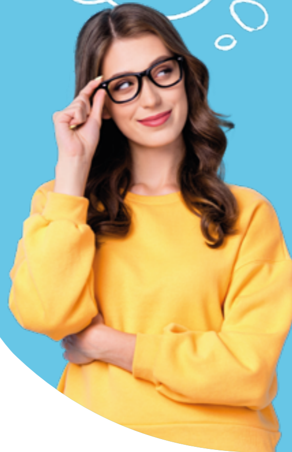
Figura professionale più richiesta: Digital Communication Manager