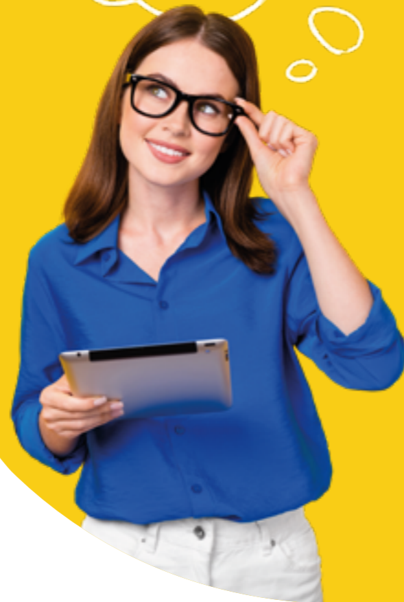
Figura professionale più richiesta: Legal Specialist