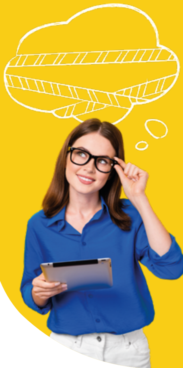
Figura professionale più richiesta: Criminologo Investigativo e Forense