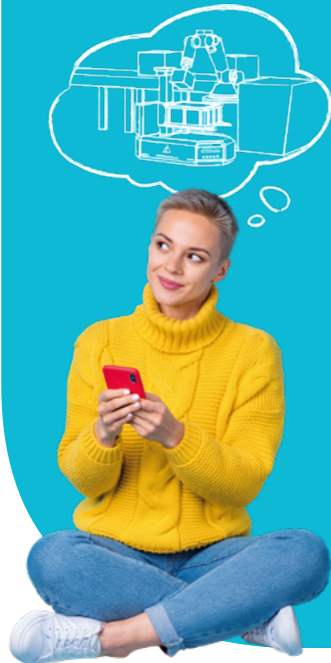
Figura professionale più richiesta: Supply Chain Manager