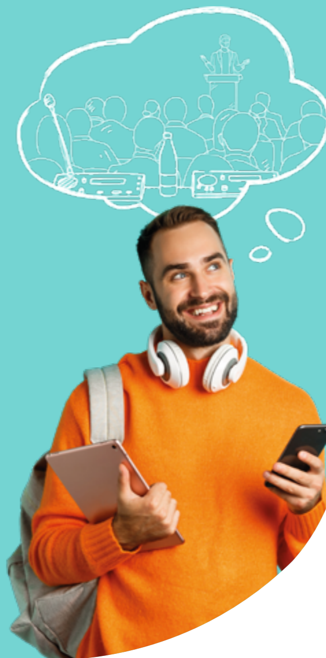
Figura professionale più richiesta: Export Manager