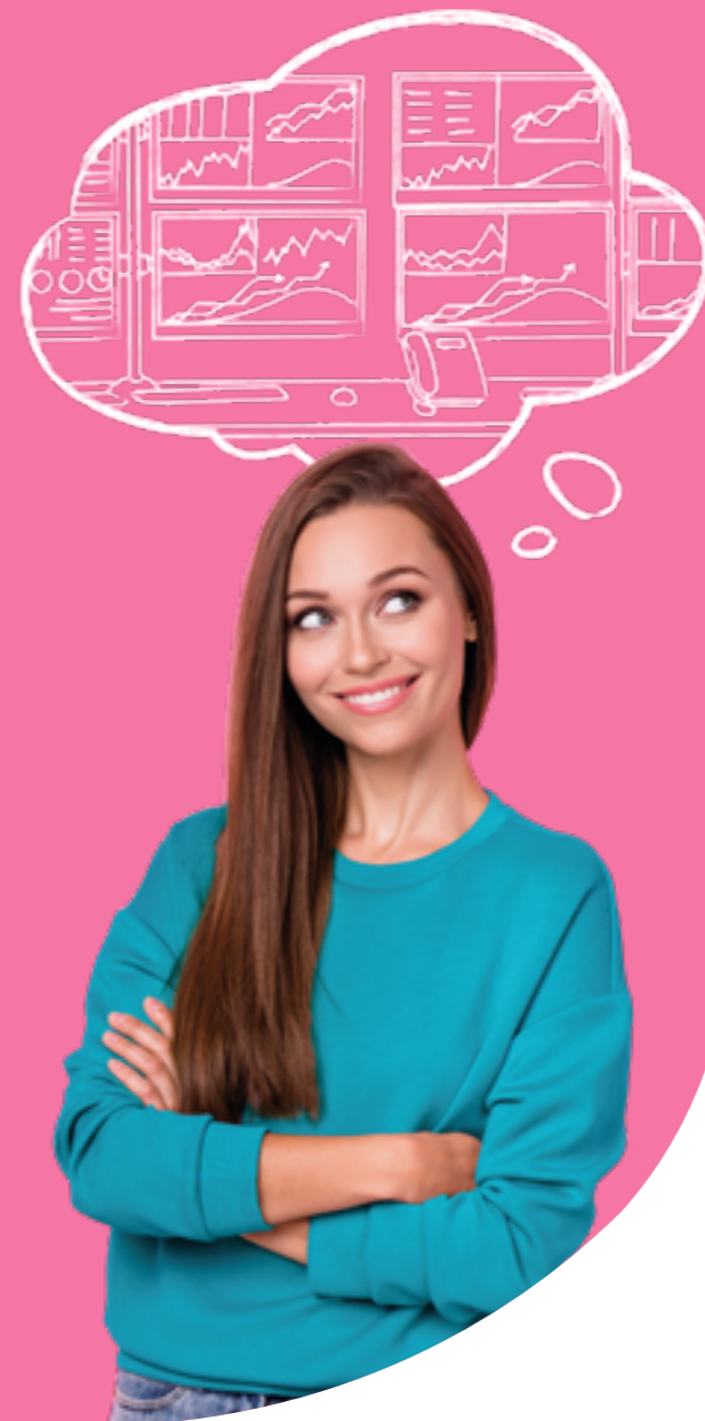
Figura professionale più richiesta: Risk Manager