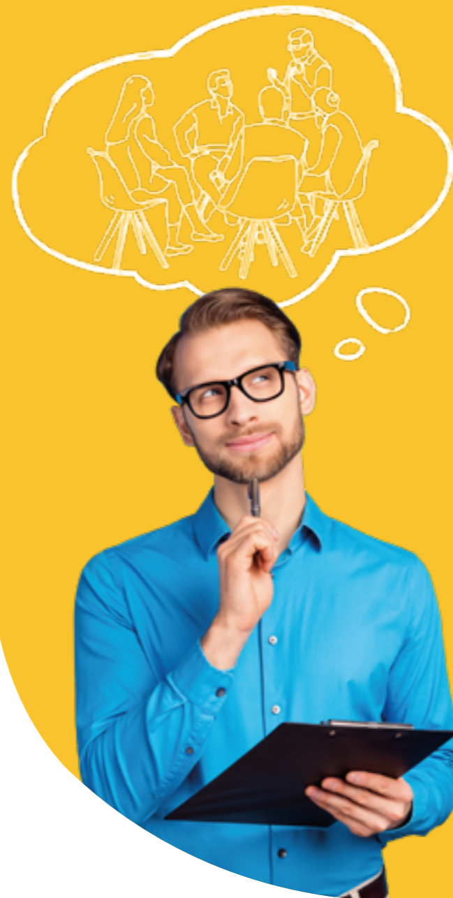
Figura professionale più richiesta: Psicologo del Lavoro