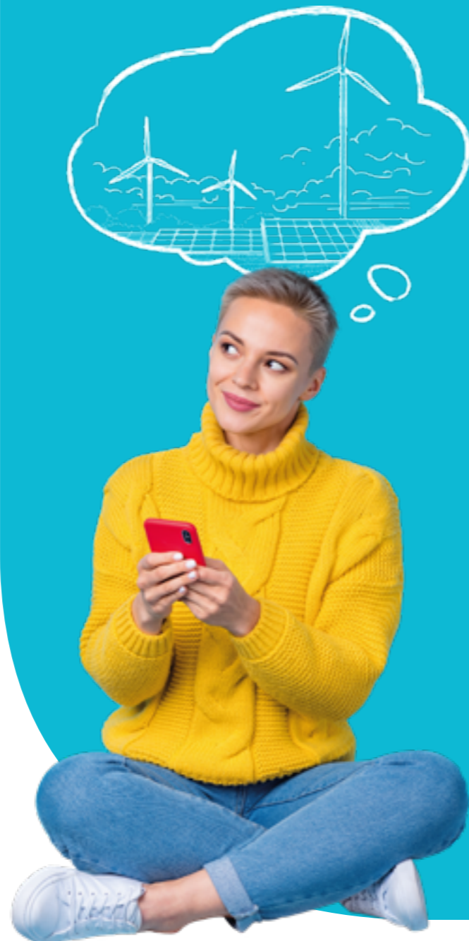
Figura professionale più richiesta: Ingegnere dei Processi produttivi