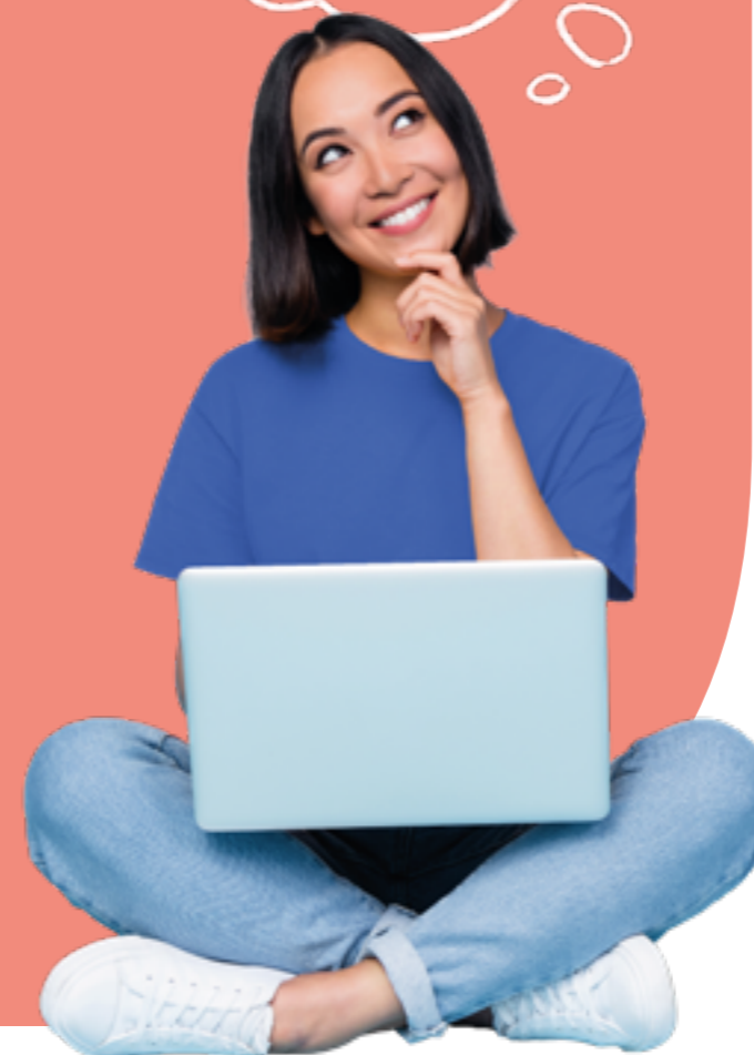
Figura professionale più richiesta: